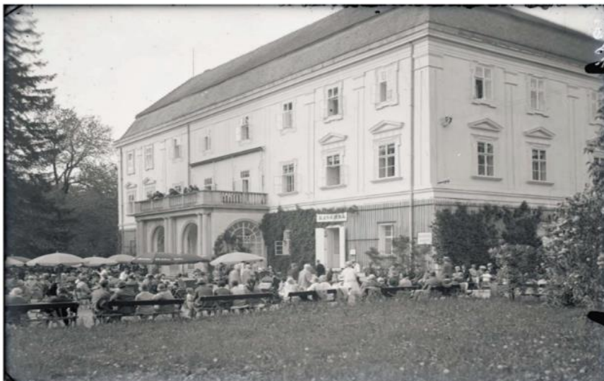
Zámek Zlín ve třicátých letech 20. století

mnohaletých jednáních získal zámek ve Zlíně s 2400 hektary za 470 000 zlatých od vdovy po knížeti Güntru Stollbergovi, která se ocitla ve finančních těžkostech. Zámek a domy ve Zlíně, Malcově a Cecilienhofu (Německo, Postupim) byly ve špatném stavu, neboť dřívějšímu majiteli chyběly prostředky na údržbu.