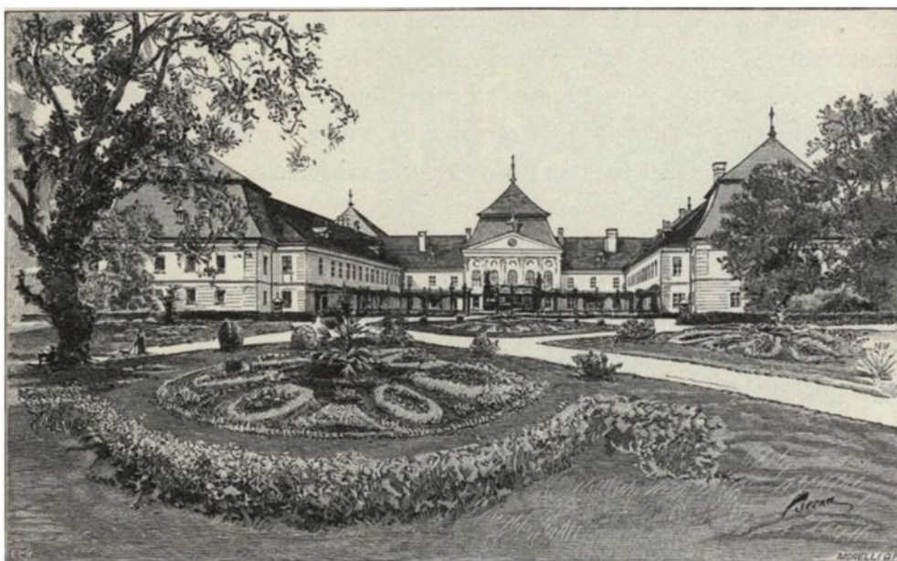
Zámek Tovarníky v Horním Maďarsku, dnešní Slovensko, sídlo rodu Haup-Stummer von Tavernok